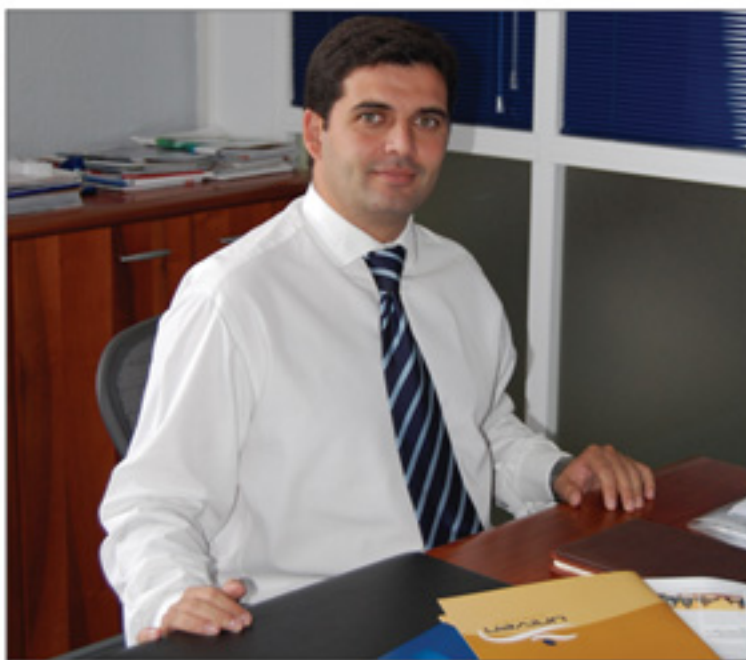
Super pie de foto. / E&F

En cuanto a Bionaturis, una iniciativa campus de la Universidad de Cádiz dedicada a la biotecnología, el apoyo ha supuesto una cifra superior 300.000 euros. El crecimiento experimentado por la empresa y la solvencia de sus proyectos de I+D+i han